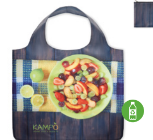
MB1110 Składana torba XL z etui zapinającym na zamek. PET w 100% pochodzący z recyklingu. Wymiary: 49x60 cm.