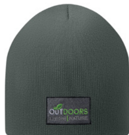
MW1101 DWUWARSTWOWA CZAPKA TYPU BEANIE. RPET. Uniwersalny rozmiar.