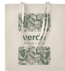
Zimde MO6190 Torba na zakupy z bawełny organicznej z długimi uchwytnymi. 140 gr/m 2 .