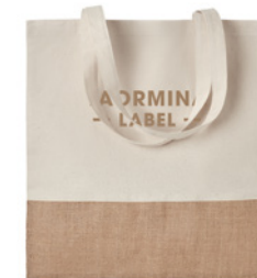
India Tote MO9518

Torba na zakupy z juty z długimi uchwytami, laminowana i zapinana na rzep, z przodu z płócienną kieszenią i bawełnianą taśmą.