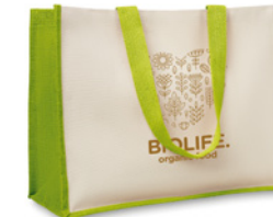
Campo De Fiori MO8967

Bawełniana torba na zakupy z elementami z juty. Długie ręczki. 160 g/m 2 . Wyprodukowano zgodnie ze standardem OEKO-TEX.