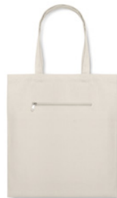
Moura Original MO8634

Składana torba na zakupy z bawełny o gramaturze 105 g/m 2 , z krótkimi uchwytami oraz z etui zamykanym na sznurek. Wyprodukowano zgodnie ze standardem OEKO-TEX.