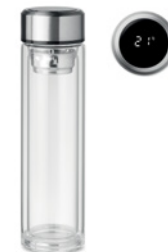
Pole Glass MO6169

Szklany kubek z silikonową pokrywką i uchwytem. Pojemność 350 ml. Kubek posiada pojedynczą ściankę, więc może się nagrzewać.