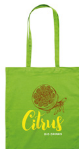
Cottonel Colour + MO9268

Torba na zakupy z bawełny 140gr/m 2 , z długimi uchwytami. Wyprodukowano zgodnie ze standardem OEKO-TEX.