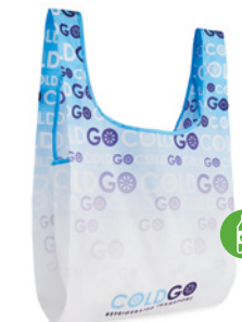
MB1111 Składana torba na zakupy ze 100% RPET z wewnętrzną kieszenią. Wymiary: 41x63 cm.