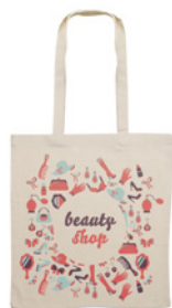
Cottonel + MO9267

Bawełniana torba na zakupy z krótkimi uchwytami. 140gr/m 2 . Wyprodukowano zgodnie ze standardem OEKO-TEX.