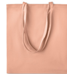
Zimde Colour MO6189 Torba na zakupy z bawełny organicznej z długimi uchwytnymi. 140 gr/m 2 .