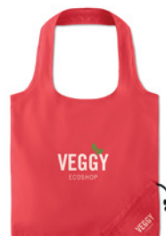
Fresa Soft MO9639

Torba na żywność wielokrotnego użytku. Jedna strona jest wykonana z bawełny (140gr/m 2 ), a druga z bawełny siatkowej (110gr/m 2 ). Zamknięcie sznurkiem. Wyprodukowano zgodnie ze standardem OEKO-TEX.