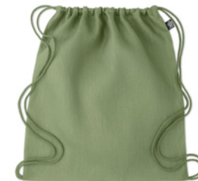
Naima Bag MO6163 Worek ze sznurkiem w 100% z konopi. 200 gr/m 2 .