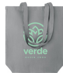
Naima Tote MO6162 Torba na zakupy ze 100% tkaniny konopnej z długimi uchwyty. 200 gr/m 2 .