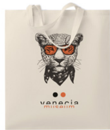
Marketa + MO9847

Bawełniana torba na zakupy z krótkimi uchwytami. 140gr/m 2 . Wyprodukowano zgodnie ze standardem OEKO-TEX.