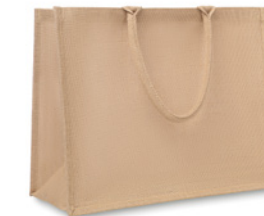
Brick Lane MO8965

Jutowa torba na zakupy, wewnątrz laminowana, z zewnątrz płócienna. Posiada długie, bawełniane uchwyty.