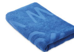
MT4005 MT4005 Tkany ręcznik plażowy (100% bawełna). MT4005 produkcja europejska. MT4008 produkcja dalekowschodnia