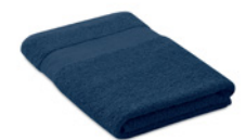
Perry MO9932 Ręcznik frotte wykonany w 100% z bawełny organicznej, gramatura 360 g/m 2 . 140x70 cm.