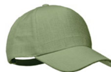
Naima Cap MO6176 5-panelowa czapka z daszkiem ze 100% konopi 370 gr/m 2 z mosiężnymi klipsami na regulowanym pasku. 5 dziurek wentylacyjnych obszytych w dopasowanym kolorze. Rozmiar 7 1/4.