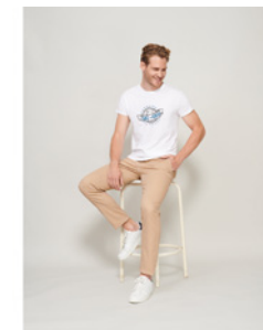
Epic S03564 SOL'S EPIC T-shirt unisex z bawełny organicznej, prążkowany kołnierzyk, okrągły dekolt i nowoczesny krój, dzianina cylindryczna. Szczegóły materiału 140g/m 2 , single jersey 100% organicznej bawełny. Rozmiar: XS-4XL.