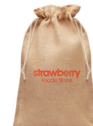
Jute Large MO9930

Przyjazna środowisku jutowa torba na zakupy z bawełnianymi rączkami.