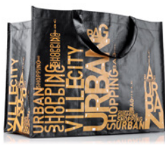
MO4120 POZIOMA TORBA NA ZAKUPY. Wymiary: 42 x 32 x 24 cm.