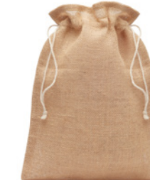
Jute Small MO9928

Srednia torba prezentowa z juty 25x32 cm.