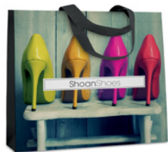
MO4340 POZIOMA TORBA NA ZAKUPY. Wymiary: 45x35x10 cm.