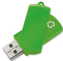
MO1082 100% plastiku z recyklingu.