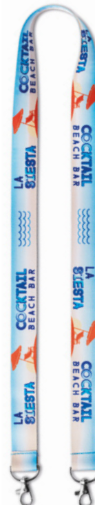
ML1016 Gładki poliester. ML1316 100% RPET.