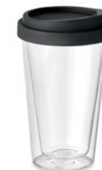
Bielo Tumbler MO9927

Pojemnik na lunch ze szkła borokrzemianowego z hermetyczną pokrywką z PP. Nadaje się do mikrofalówki. Pojemność 900 ml.