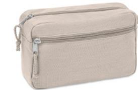
Naima Cosmetic MO6165 Kosmetyczka z podwójnym zamkiem. 100% tkanina konopna. 200 gr/m 2 .