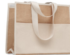
Campo De Geli MO6160

Bawełniana torba na zakupy z długimi uchwytami. 140 gr/m 2 . Wyprodukowano zgodnie ze standardem OEKO-TEX.