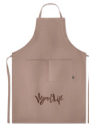
Naima Apron MO6164 Regulowany fartuch kuchenny z 2 przednimi kieszeniami ze 100% tkaniny konopnej. 200 gr/m 2 .