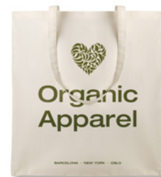
Organic Cottonel MO8973 Torba na zakupy z długimi uchwytnymi, wykonana z bawełny organicznej 105 gr/m 2 .