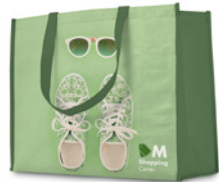
MO4080 POZIOMA TORBA NA ZAKUPY. Wymiary: 42x32x16 cm.