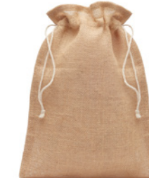
Jute Medium MO9929

Duża torba prezentowa z juty 30 x 47 cm.