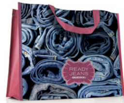
MO4070 POZIOMA TORBA NA ZAKUPY. Wymiary: 36 x 32 x 12 cm.